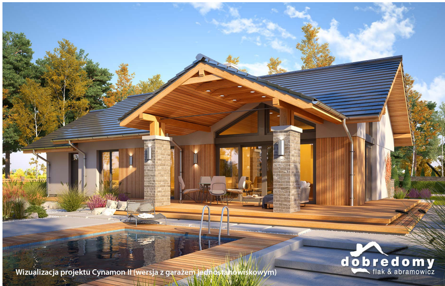
Wizualizacja projektu Cynamon II (wersja z garażem jednostanowiskowym)

autor: Marcin Abramowicz Marta Zaperty-Adamek cena projektu: 4 540 zł