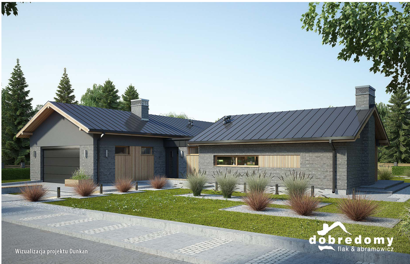
Wizualizacja projektu Dunkan

autor: Marta Zaperty-Adamek Marcin Abramowicz cena projektu: 5 190 zł