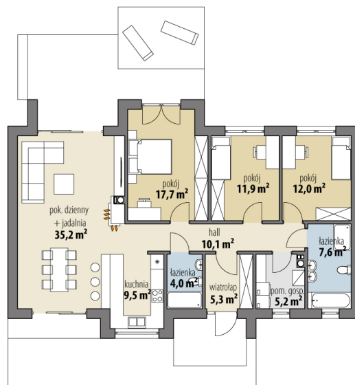
LOLA - alternatywna wersja rzutu