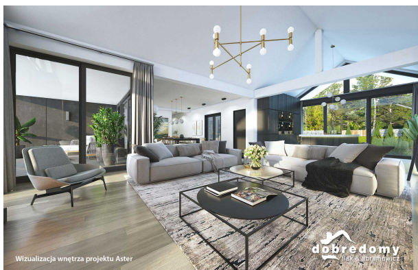
Wizualizacja wnętrza projektu Aster