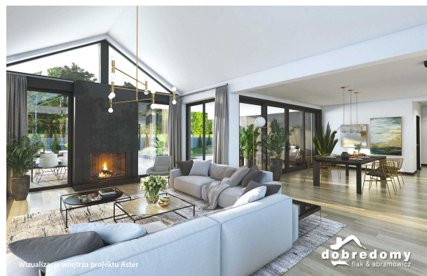
Wizualizacja wnętrza projektu Aster