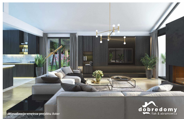
Wizualizacja wnętrza projektu Aster