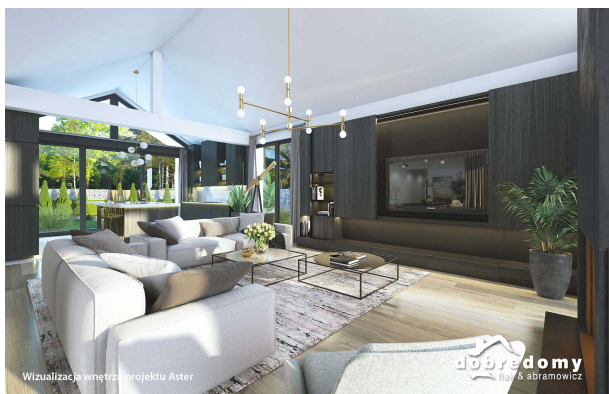
Wizualizacja wnętrza projektu Aster