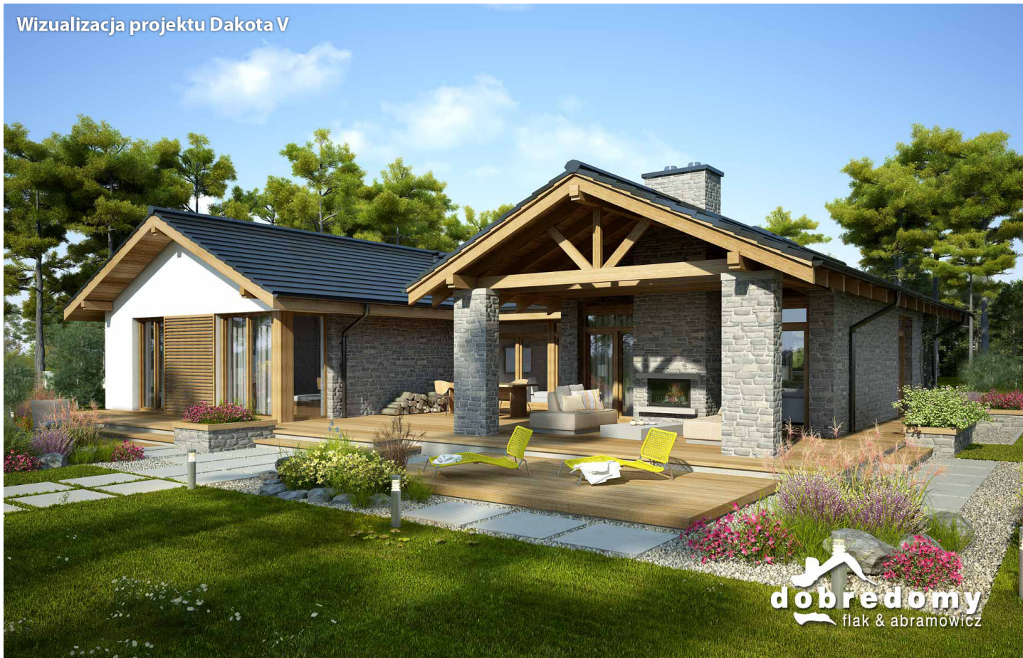
Wizualizacja projektu Dakota V

autor: Marcin Abramowicz Marta Zaperty-Adamek cena projektu: 5 590 zł